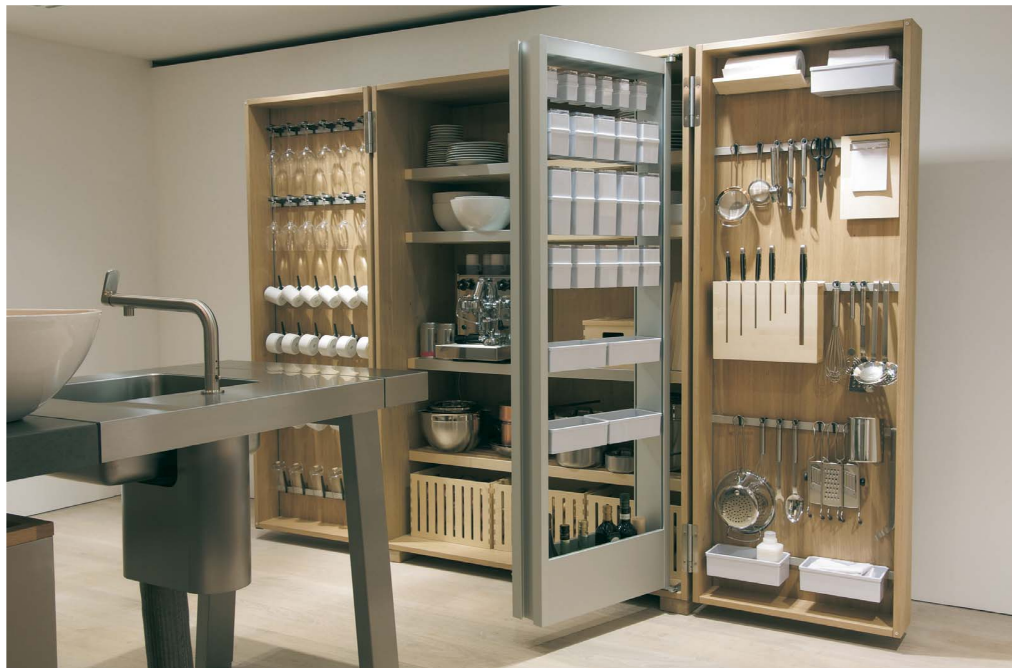
Cucina B2 disegnata da Eeos per Bulthaulp, con piano di lavoro e mobile contenitore. The B2 Kitchen designed by Eeos for Bulthaulp, with its worktop and container element

È il tema dominante: contenere. Contenere le spese, i consumi, lo spreco, i prezzi, il disavanzo, l'energia, i vegetali, i rifiuti, l'acqua, l'aria e via dicendo. Il fine è quello di accogliere in sé ma soprattutto di controllare, limitare e ridurre, nel tentativo di preservare il pianeta dall'estinzione.