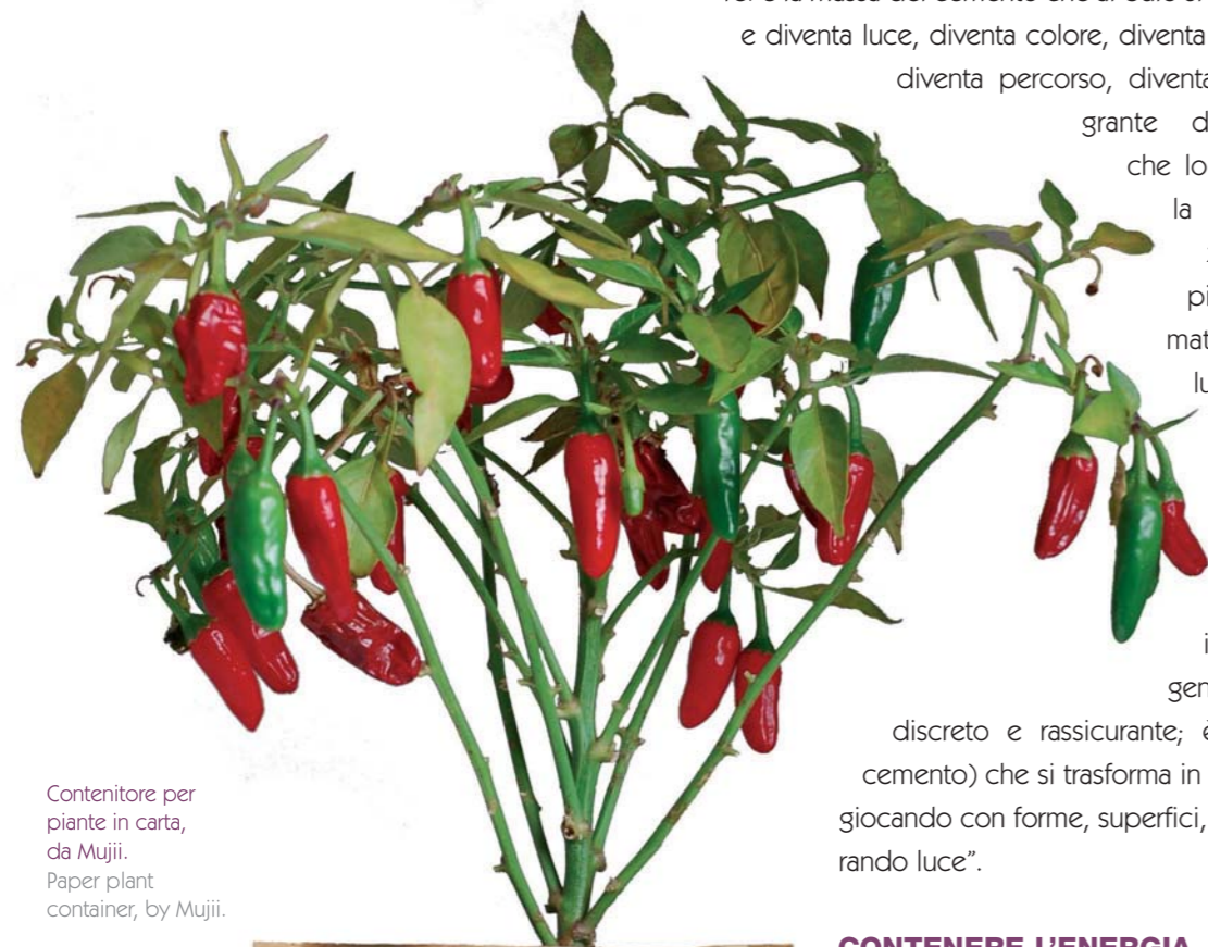
Contenitore per piante in carta, da Mujii. Paper plant container, by Mujii.

A Marco Merendi, designer di FontanaArte e Davide Groppi, ho chiesto se in qualche modo si potesse contenere la luce. "È uno dei temi principali dei miei progetti, fare in modo che la luce sia contenuta in oggetti che contemporaneamente svolgono anche altre funzioni. Smile, ad esempio, lavora sulla 'concretezza' (dall'inglese 'concrete', cemento), la stabilità, la matericità, la dimensione urbana. È un dissuasore che diventa lampada, è la lampada che diventa dissuasore: è la massa del cemento che al buio si smaterializza e diventa luce, diventa colore, diventa indicazione, diventa percorso, diventa parte integrante dell'ambiente che lo circonda; è la contrapposizione tra pieno e vuoto, materia e aria, luce e ombra; è la solidità di un oggetto fatto per vivere in mezzo alla gente in modo discreto e rassicurante; è materia (il cemento) che si trasforma in volume puro giocando con forme, superfici, tagli e generando luce".