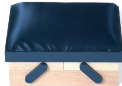
Set di scatole contenitore realizzate da 5.5 Designers per Coincasa. Set of storage boxes created by 5.5 Designers for Coincasa.