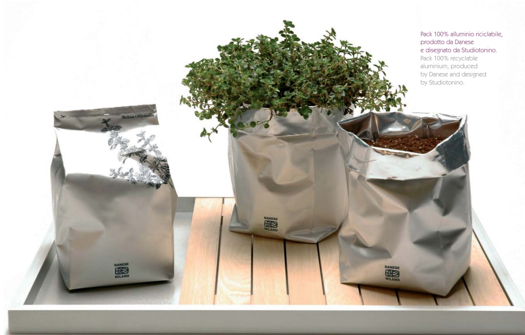
Pack 100% alluminio riciclabile, prodotto da Danese e disegnato da Studiotonino. Pack 100% recyclable aluminium, produced by Danese and designed by Studiotonino.

l'autarchia vegetale, quel fenomeno che vede il proliferare di orti e piantagioni su terrazzi e balconi. Ed è proprio in quel senso dell'“aver cura” della natura che, per conto di Danese, Studio Tonino realizza Pack, un sacchetto in alluminio riciclato atto a contenere in ambiente domestico quelle specie vegetali spesso ignorate ed escluse dai giardini, ma necessarie alla salute dell'ecosistema. Dicono: “Sono le piante degli spazi residuali, delle crepe tra i muri, dei luoghi di scarto tra le edificazioni urbane che Pack accoglie per avvicinarsi alla diversità con stupore, riconosce l'utilità dimenticata e riscopre la bellezza. Una scelta che estende l'attenzione di ognuno all'esuberanza imprevedibile della natura che si manifesta senza distinzioni tra centri e periferie, ma compone in libertà – quello che i paesaggisti come Gilles Clément definirebbero – il “Giardino Planetario”.